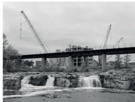
NICOLAS FLOC'H, SIOUX FALLS, DAKOTA DU SUD, SÉRIE FLEUVES OcéAN - MISSISSIPPI 2022.