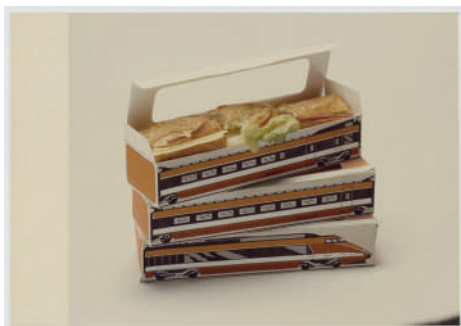
« SANDWHICH 260 » PROPOSÉ À BORD DES TGV, 1981.

Les participants et participantes sont invités à explorer leur sens et à découvrir le monde de la synesthésie. A partir d'une petite dégustation et de différents matériaux à toucher, ils et elles pourront explorer les photographies du festival d'une autre manière.