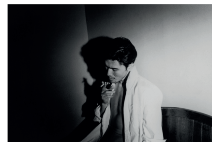
NOMURA SAKIKO, SANS TITRE, 1998, SÉRIE HIROKI.