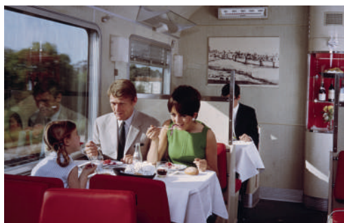
SERVICE À BORD D'UNE VOITURE-RESTAURANT DU TRAIN CAPITOLE, 1966.